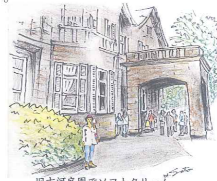
旧古河庭園でソフトクリーム

駒込駅界隈の散策です。本郷通りを南に行くとなら、六義園につきます。六義園は元禄年間、柳沢吉保が下屋敷に造った庭園。真ん中に池と島があり周りの樹林は紀州の景勝などが映し出されているそうです。定期的にツツジも終わりかけ、アジサイが咲き始めていました。春には、入口 すぐの枝垂れ桜が有名ですね。 駅の方にもどり、そば屋で腹ごしらえ。二人で鴨南そば、せいろにかき揚げの小井と日本酒1合、ちょっとしあわせ。 そば屋を出て反対方向にしばらく歩くと、旧古河庭園の瀟洒な洋館が見えてきます。建物は御茶ノ水のニコライ堂などを設計したコンドル最晩年の作だそうです。いま(5月)はバラが満開で、フランス式庭園と建物との調和が絵画的です。バラの名前も、マサコ、ロイヤルプリンセス、初恋、など珍しい品種のバラが咲き誇っています。一段下がって裏の方には、日本庭園が静かな広がりを見せてくれます。日差しが強い日だったので、庭内のアイスクリーム販売車でソフトクリームを所望。展示案内をみると、八王子堀之内の野猿街道沿いにある、ダ・ルチアーノという、おいしいジェラード店が志向しているんですね。商売は大変です。 庭園を出て駅に向かう途中に霜降銀座商店街という昭和にタイムスリップしたような商店街をぶらぶらとして、途中から住宅地の中を適当に歩いてみると、染井稲荷神社に出ました。このあたりは昔園芸の町として栄えていたそうで、ソメイヨシノ発祥の地でもあるそうです。駅に戻り、今回は3～4時間コースでしょうか。 佐藤